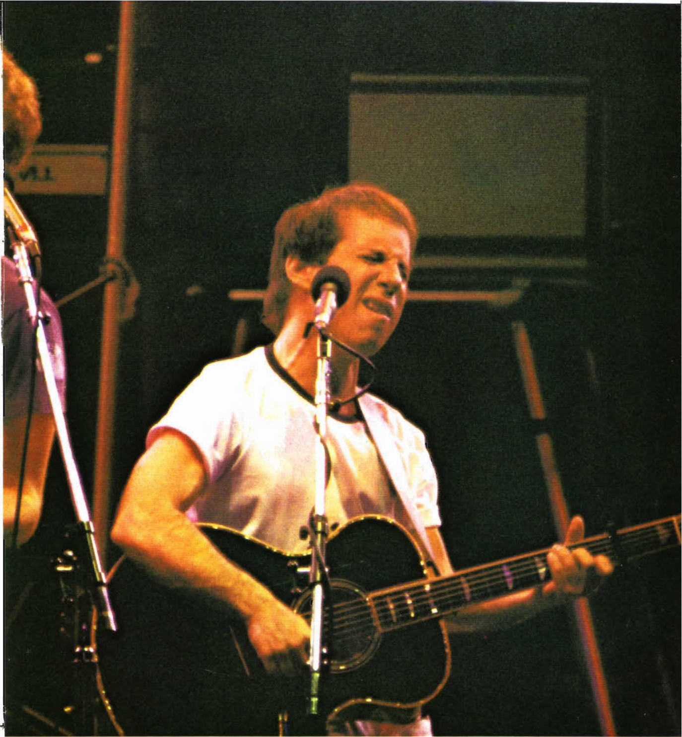
▲サイモン（右）とガーファンクル

40歳の若者——というのもおかしいが、ヤングから中年まで幅広い人気を持つアメリカのフォーク・デュオ「サイモンとガーファンクル」が復活。初の日本公演が実現した。