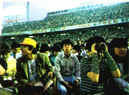
後楽園球場を4万人のファンが埋めた。10代から20代のヤングが目立った。

もっとも、アイドル歌手やかつてのピンク・レディー、キャンディーズのようなステージと違って聴く姿勢はきわめてアダルトっぽい。「これが音楽だ」というようなさわやかな感動と余韻を4万人（10日、後楽園）の聴衆に残し、サイモンとガーファンクルは去っ